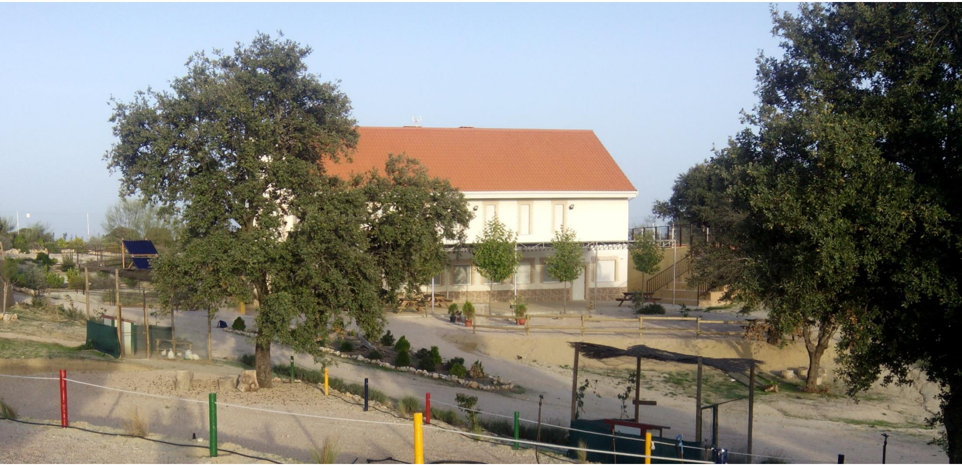
Vista general del Edificio