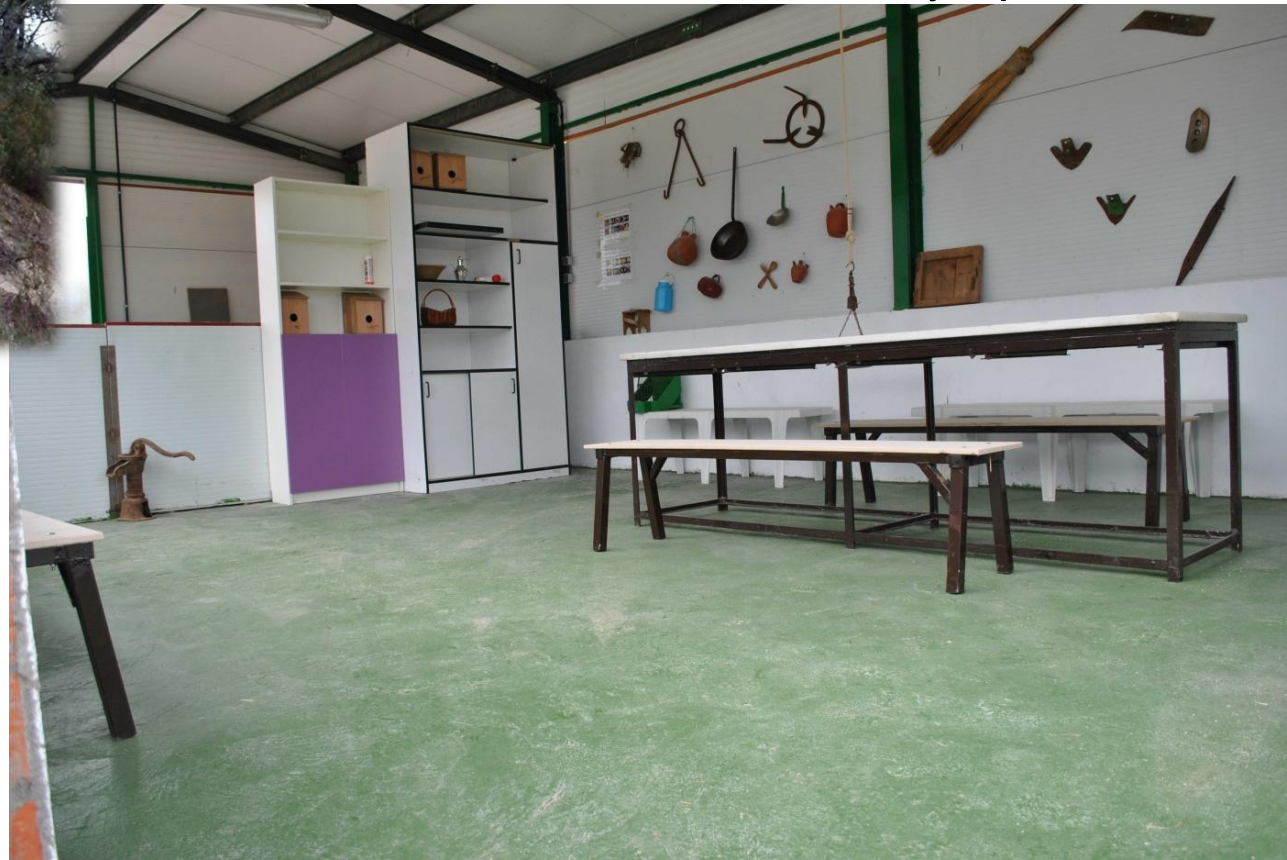
Taller de animales y aperos