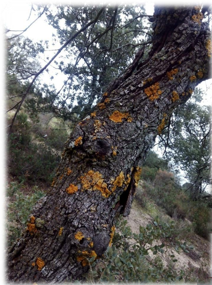
Monte autóctono de encianas