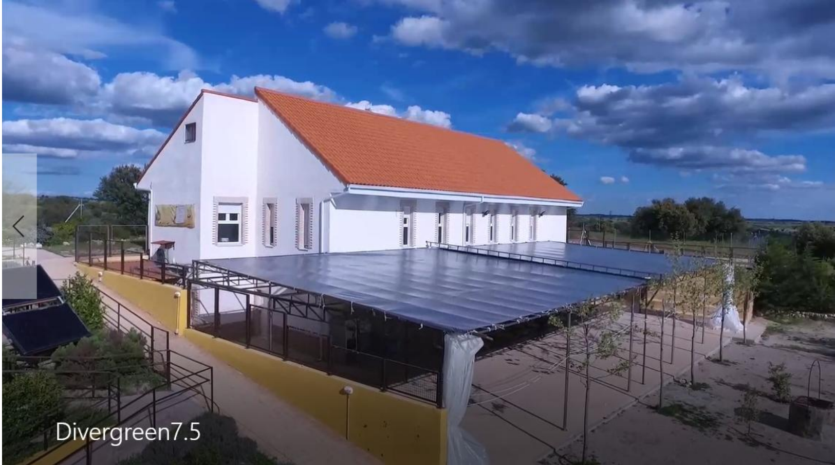
Vista general del Edificio