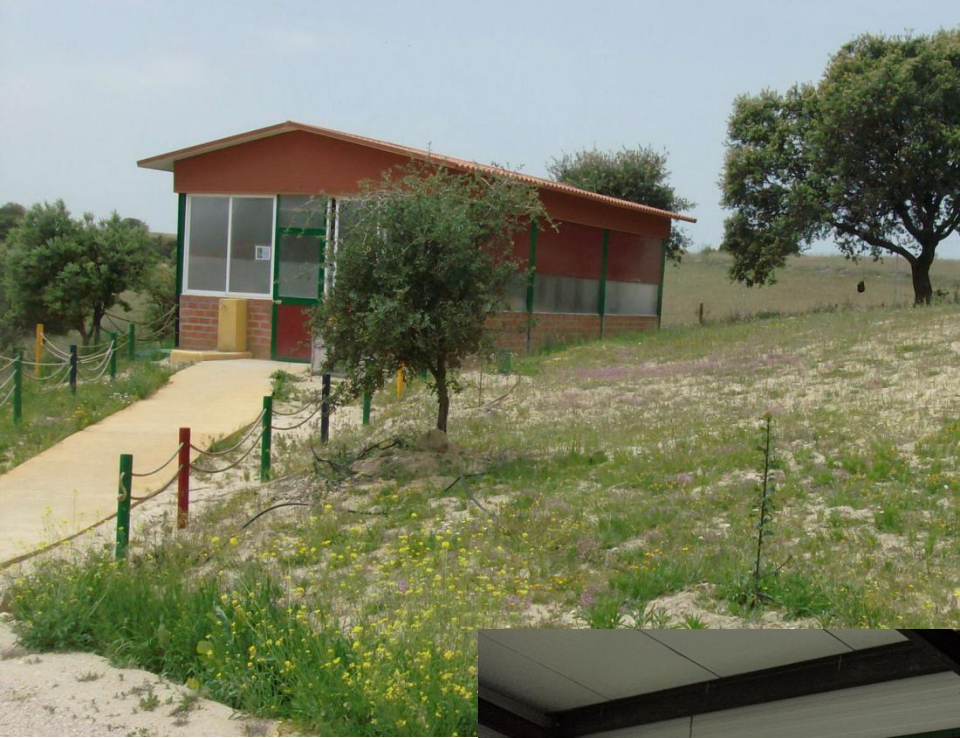
Aula de Naturaleza