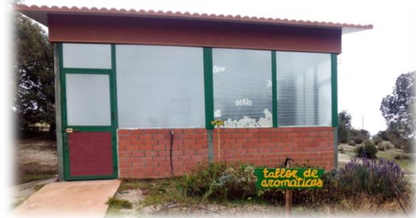
Taller aromáticas exterior