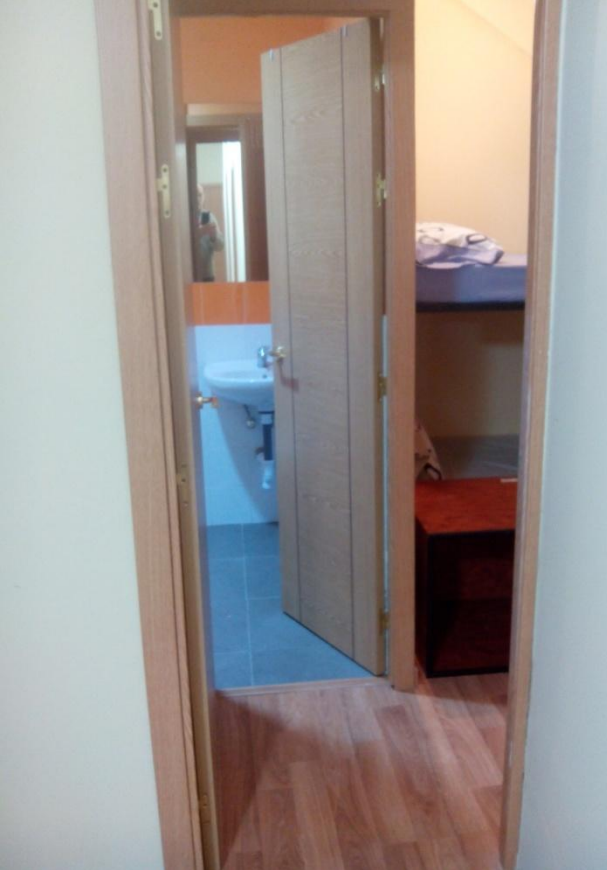
Habitación con baño