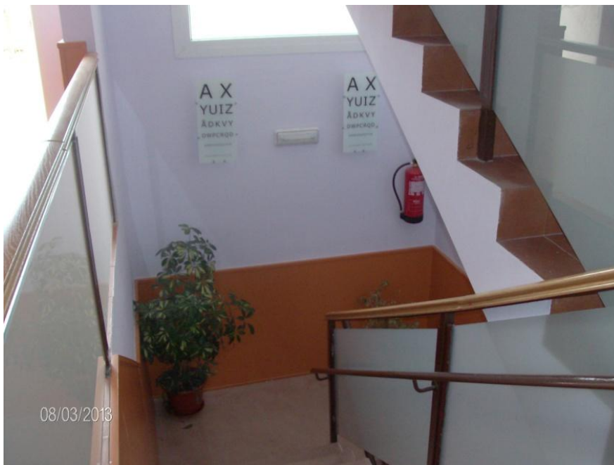
Escalera de bajada al comedor