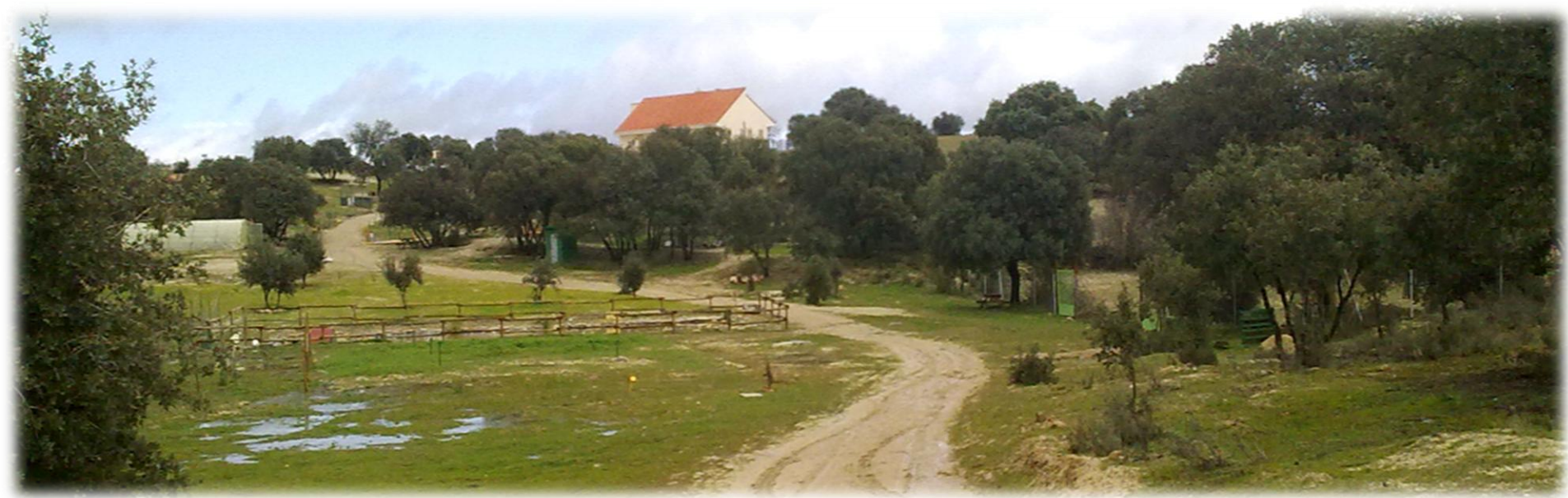
Finca y edificio visto desde zona de animales