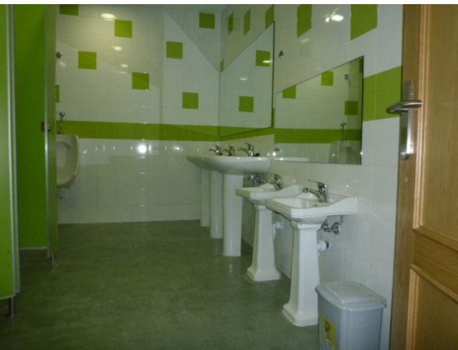
Baño de chicos con dos alturas